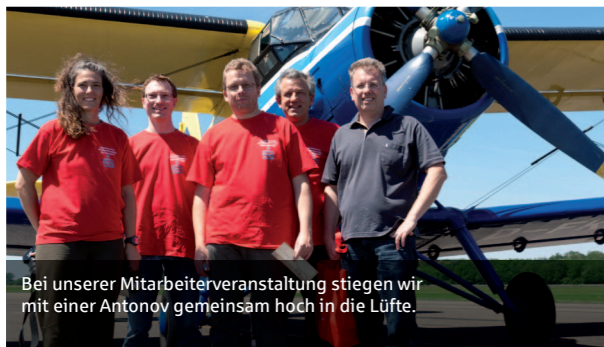
Bei unserer Mitarbeiterveranstaltung stiegen wir mit einer Antonov gemeinsam hoch in die Lüfte.

Eine neue Dimension erlebten die Mitarbeiter bei der jährlichen Mitarbeiterveranstaltung. Unter dem Arbeitstitel „WIR.2020“ informierte das Haus im Juli 2011 über die künftige Ausrichtung der Sparkasse. In spannenden Workshops diskutierten die Mitarbeiterinnen und Mitarbeiter angeregt über Leitbild und Vision der Sparkasse Staufen-Breisach, strategische Ausrichtung des Unternehmens und deren konkrete Umsetzungsmöglichkeiten. Neben dem fachlichen Austausch sollten auch Geselligkeit und der Spaß nicht zu kurz kommen. Die besondere Art der Veranstaltung in Form von Marktständen lud zum fachlichen und kreativen Diskurs in lockerer Atmosphäre ein. Wieder einmal konnten wir die Leitvision der Sparkasse Staufen-Breisach mit Leben füllen: „Wir können mehr. Die Menschen machen den Unterschied.“ Sie soll den Mitarbeitern in turbulenten Zeiten und bei ihrer täglichen Arbeit Motivation und Orientierung sein.