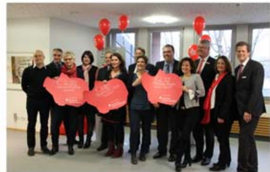
Die Spendenübergabe aus der Aktion „Wünsch