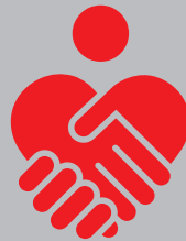
B2 Run in Freiburg