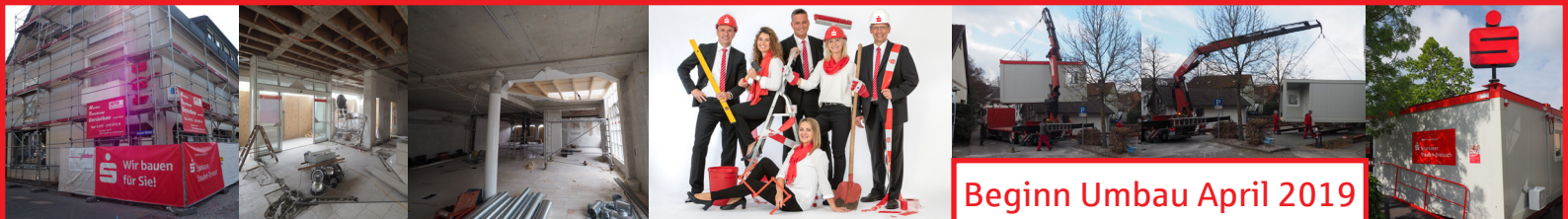
Beginn Umbau April 2019