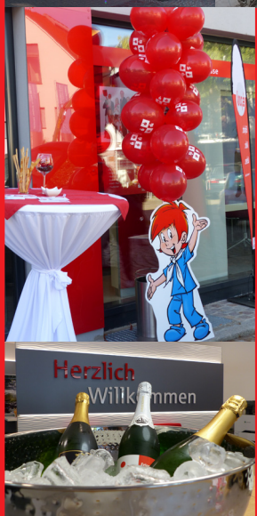
Eröffnung Oktober 2019